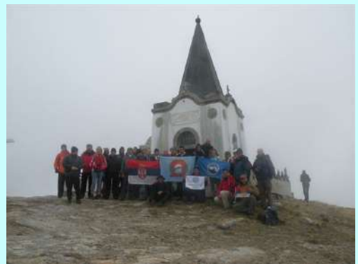
Zastave i planinari na vrhu