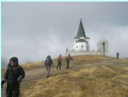
Crkva na vrhu

Planinarsko smučarsko društvo „Železničar“ i Planinarsko društvo „Pobeda“ su organizovali tradicionalni izlet na Olimp i Kajmakčalan u okviru svojih zajedničkih planova i saradnje. Mesto u autobusu je bilo samo za one koji su se na vreme javili vodičima. Do zadnjeg mesta popunjen autobus je krenuo u petak naveče. Naviknuti na noćnu vožnju stižemo u podnožje Kajmakčalana po planu. Dočeka nas ledeni vetar i maglovito vreme. Požurujemo jedni druge kako bi što pre krenuli na uspon. Poveća kolona je krenula. Hodanjem se zagrejasmo. Sačekujemo zaostale i pronalazimo gelere i metke iz prvog svetskog rata. Koliko li je municije utrošeno na ovim prostorima kada je i danas na svakom koraku pronalazimo? Na kraju smo skijaških žičara. Još malo pa smo na vrhu. Polako se pojavljuje vrh Kapele. Zapalimo sveće divjunacima i poklonismo se senima ratnika. Nema srpske kuće koja nije dala barem jednog vojnika u prvom ratu. Možda baš na ovim mestima počivaju naši dedovi i pradedovi. Oni koji su prvi put, presrećni su što se nalaze na vrhu čuvene istorijske planine. Nakon slikanja istim putem, se vraćamo ka autobusu.