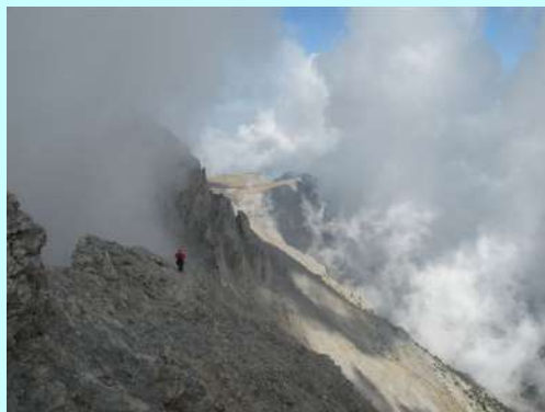
I jos jedan uspon

Nakon zasluženog odmora i okrepljenja dolazimo do autobusa. Brojno stanje u autobus nepromenjeno. Nastavljamo ka Beogradu. Usnuli autobus je sa neophodnim pauzama stigao rano u Beograd.