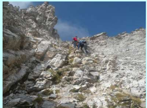
Silazak sa Stefanija

Prva grupa se uspešno vratila na Skalu neki popeše i Skolijo(2911m). Istom stazom su se vratili u dom i nakon pauze nastavili silazak do autobusa. Druga grupa se, nakon silaska sa Stefanija, popela i na Mitikas pa preko Skale, a neki i Skolija vratila u dom.