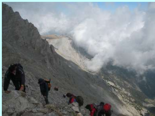
Sa Mitikasa ka Skali