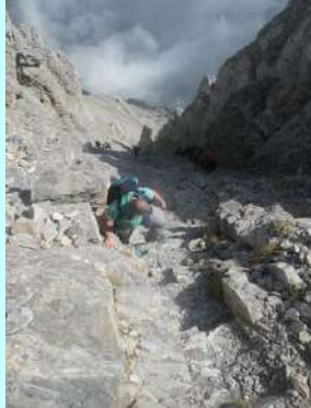
Uspon na Mitikas kroz kuloar