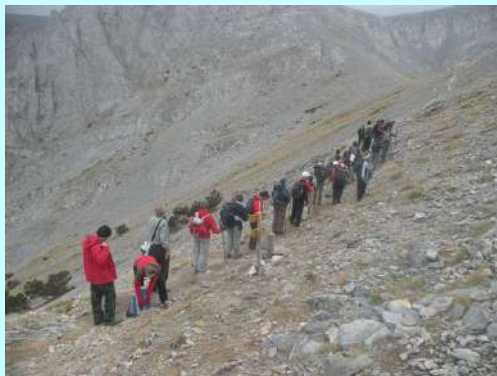
Grupa ka Skali

Sa prestankom rada generatora odlazimo na spavanje. Sutradan smo svi na nogama u zakazano vreme. Krenuli smo u cik zore. Neki još sanjivi teturaju se u koloni. Prva pauza je na raskrsnici staze. Prva grupa kreće normalnim putem ka Skali i Mitikasu, a druga ka Stefaniju i Mitikasu. Veća prva grupa je veoma brzo izašla na Skalu(2866m) i nastavila oprezno ka Mitikasu. Nakon silaska sa Skale nekih stotina metara nastavlja se uspon ka vrhu. Na putu do vrha su osigurani neki detalja sajlama što je ohrabrilo neiskusne planinare. Na Mitikasu(2918m) magla i vetar. Povremeno vetar rastera maglu pa se pojave stravični vidici. Možda je magla i saveznik početnicima. U isto vreme kad je prva grupa bila na Mitikasu druga grupa je bila na Stefaniju(2909m).