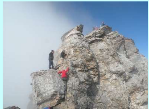
Završni uspon na Stefani

Nevidimo se ali se čujemo. Završni uspon na Stefani je nešto zahtevniji od Mitikasa. Za svaki slučaj napravili smo gelender i nadgledali svakog planinara ponaosob do metalne kutije na vrhu.